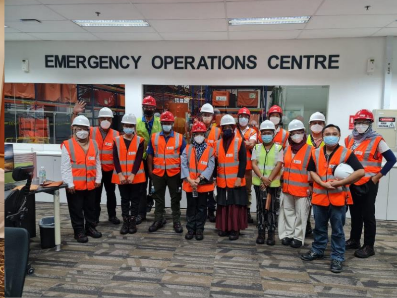
The Head of the Environment and Forestry Service of East Nusa Tenggara Province participates in the Regional Exchange on Oil Spill Preparedness and Response in Singapore.