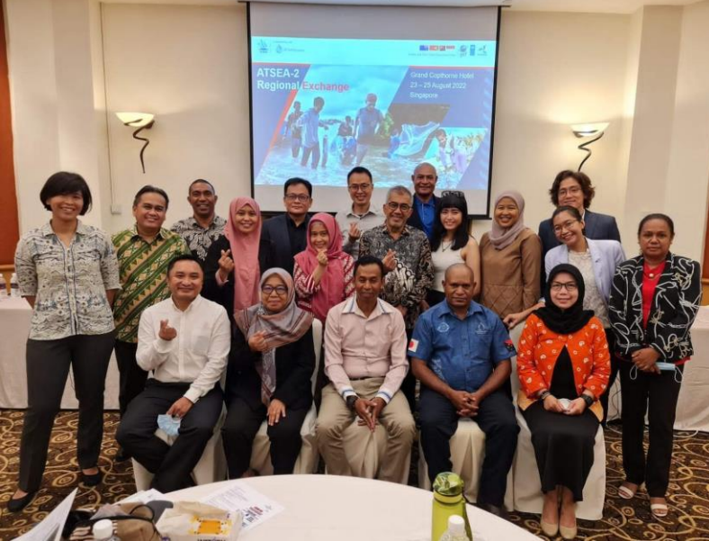
Kepala Dinas Lingkungan Hidup dan Kehutanan Provinsi Nusa Tenggara Timur berpartisipasi dalam Regional Exchange on Oil Spill Preparedness and Response di Singapura.